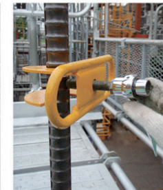
『押さえボルトを締める』 (ラチェット21mm)